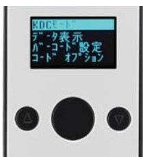
日本語対応ディスプレイ 視認性の良いOLEDディスプレイと、シンプルなボタン配置

オプションのスタンド型充電器は、単体タイプと、複数運用の場に最適な4連タイプをご用意しています。