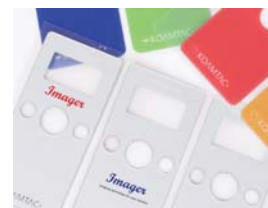
オリジナルデザインパネル (オプション) パネルカラーの変更やロゴプリントなどに対応 (100個~)