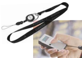
携帯に便利なネックストラップ 取外し可能なネックストラップと伸縮リールが付属