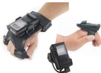
トリガー機能付きグローブ&リングスキャナ ウェアラブル用 アクセサリオプション(右手/左手用あり)