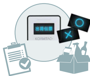
ビットマップ(.bmp)画像表示 スキャン対象物の指示や照合OK/NGなど、画像表示が可能