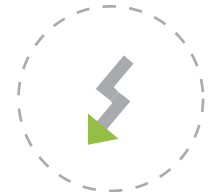
Drop Test 1.5m