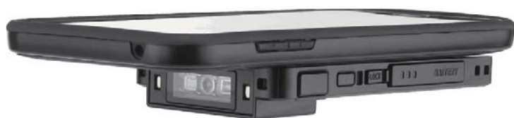
KDC470Di(1次元モデル)KDC470Ci(2次元モデル)