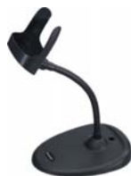
ハンズフリースタンド フレキシブルタイプ 高さ22cm STND-22F00-001-X