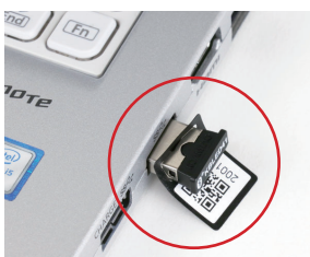
かんたん通信 USBポートに通信 Dongle を差し込むだけの簡単接続

また、バイブレーター搭載により、医療現場や図書館など動作音が出せない環境や、騒音の多い現場でも確実な読み取り作業が行なえます。