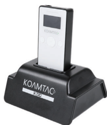
シングル充電クレードルが標準付属 複数台の運用現場に最適な、4 連クレードルオプション