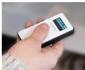
日本語対応ディスプレイ 視認性の良い OLED ディスプレイと、シンプルなボタン配置