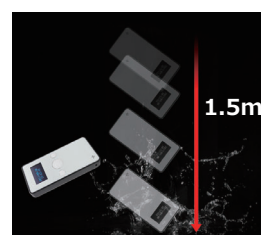
耐久性に優れた設計 IP65 準拠の防塵防滴性能と、1.5m の耐落下性能