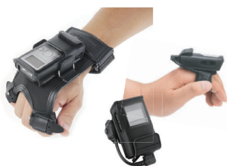
トリガー機能付きグローブ & リングスキャナ ウェアラブル用 アクセサリオプション (右手 / 左手用あり)