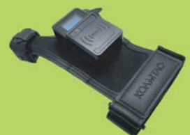
フィンガートリガーグローブモデル