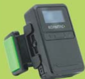
電磁誘導充電 搭載モデル 電磁誘導充電 非搭載モデル