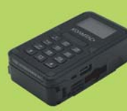
キーボードモデル