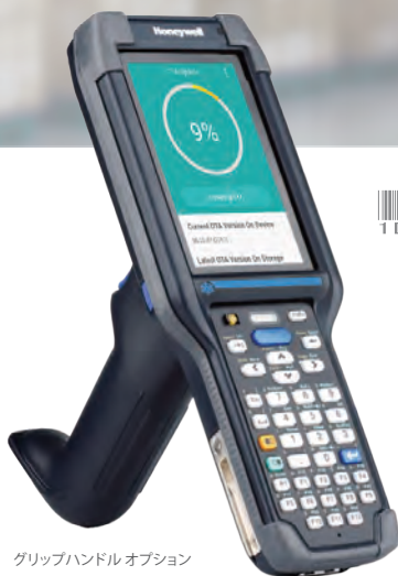
グリップハンドルオプション

Mobility Edgeプラットフォームを採用 Android OS のアップグレード対応により長期運用 長時間運用 5,200mAhスマートバッテリー搭載