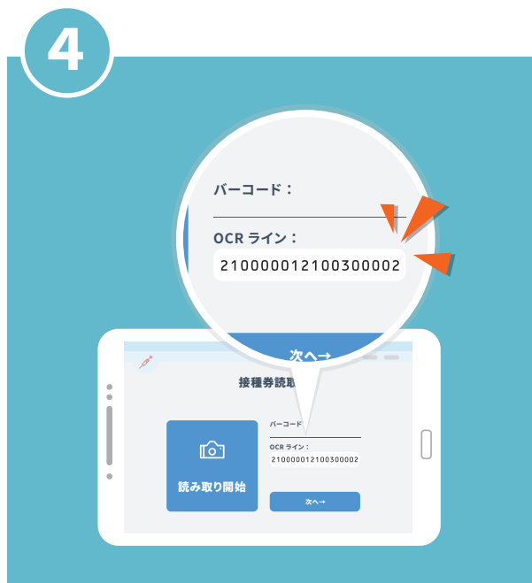
入力フォームに読み取ったデータが反映されます