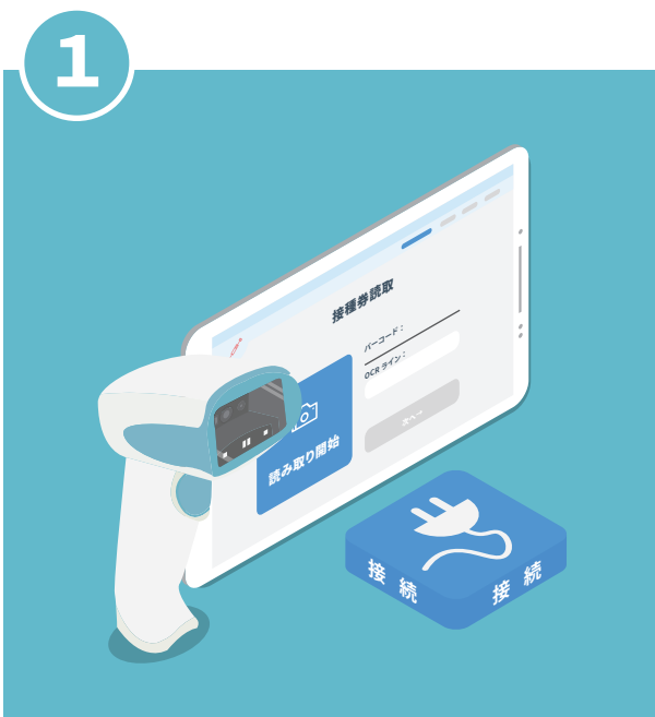
タブレットとバーコードリーダーを付属のケーブルで接続します