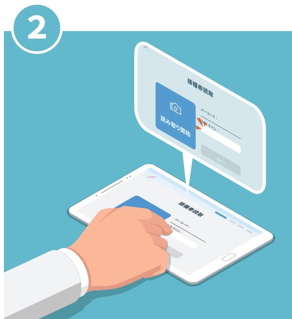
入力カーソルをタップします