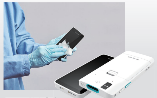
ヘルスケアハウジングモデル