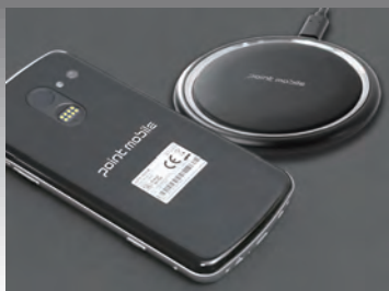
背面に配置された「指紋センサー」と「ワイヤレスチャージング」機能

製品のライフサイクルサポートは7年までの延長が可能です。アップデートの他、デバイスのセキュリティも大きく向上し、長期運用による資産維持コストの削減に大きく貢献します。