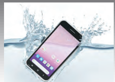
IP67準拠で水やホコリを徹底ガード